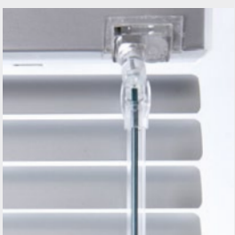
Ultrawand (tillval) – vinkla och lås persiennen i ett (Embla, Grip och Saga)