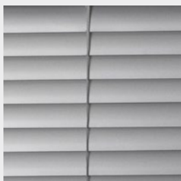
Privacy-funktion (tillval 25 mm) gör att inget ljus tränger igenom lamellhålen